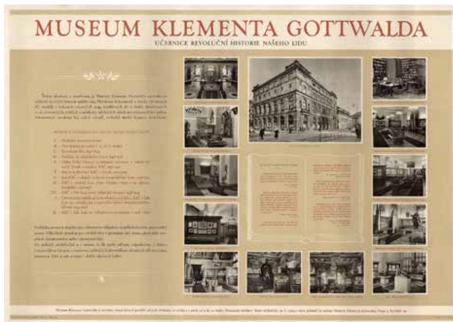
Obr. 3: Plakát Museum Klementa Gottwalda. Učebnice revoluční historie našeho lidu (autor neuveden, nakladatelství Orbis, 1955). Národní muzeum, Sběrka Muzea dělnického hnutí, H11P-91.

bojovníka, s nimiž se může většina pracujících ztotožnit. Nejen běžné zaujetí vizualitou barvy a textu, ale právě kompozice scény a výběr aktérů, oslovuje potencionální návštěvníky výstavy – masy pracujících. Plakát z produkce národního podniku pro průmysl grafický a nakladatelství Melantrich 56 byl využit nejen pro kampaň ve veřejném prostoru, ale i na obálku 8. svazku Aktualit v obrazech . 57 Dopad propagace volně prodejným tištěným médiem je zřejmý, když zjistíme, že jeho 6. svazek téhož roku byl věnován vítězství našich hokejistů na MS ve Stockholmu. V 70. a 80. letech je motiv Čumpelíkova dělníka použit na plakátech či předmětech k výročí LM. Bohužel, i když i v dalších letech vznikaly kvalitní autorské předlohy, většinou pro politické plakáty, tak MKG se tímto směrem nevydalo.