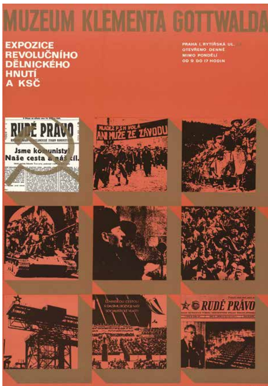
Obr. 4: Plakát Muzeum Klementa Gottwalda. Expozice revolučního dělnického hnutí a KSC (autor neúveden, nakladatelství Rudé právo, 1974). Národní muzeum, Sběrka Muzea dělnického hnutí, H11P-315.

Ze symbolů je zde použit srp a kladivo ve zlaté barvě, ovšem v nevýrazném umístění na jedné z fotografií. Přímo k otevření existuje strohý typoplakát SLAVNOSTNÍ OTEVŘENÍ NOVÉ EXPOZICE MKG 30. 4. 1974 , kde černý nápis na červené ploše akcentuje bíle lemovaná pěticípá hvězdička téměř ve středu plochy. 72 Dle jednoduchosti prove-