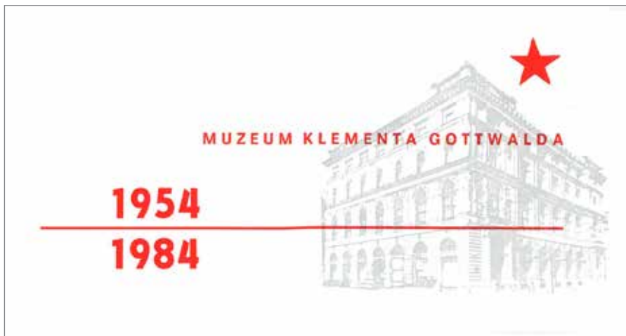
Obr. 7: Tisk k výročí Muzea Klementa Gottwalda, 1954–1984, album k 30. výročí vzniku MKG. Archiv Národního muzea, Fond Sběrka Muzea dělnického hnutí, nepracováno.

kvalitního dobového designu. Je otázkou, zda určitá absence umělecké roviny autorského vkladu tvůrců vychází jen z předpokládané ideové kontroly, nebo se tím odráží určitá obsahová vágnost prezentovaného tématu stranických muzeí a sklony k faktografickému realismu. Z řady vzorků plakátů je ale zřejmé, že to neplatí obecně pro muzejní instituce a zvláště ne pro jejich výstavy.