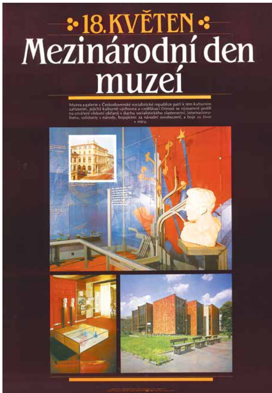
Obr. 6: Plakát 18. květen Mezinárodní den muzeí (výtvarný návrh Antonín Kalcovský, text J. Langr, nakladatelství Svoboda, 1985). Národní muzeum, Sběrka Muzea dělnického hnutí, H11P-313.

šestiúhelníku posazeného na orámanou světlou plochu a doplnění textem: „ musea dokumentují socialistickou výstavbu “. 86 Což odráží dobový ideový požadavek na dovršení budování socialismu. Na plakátu TÝDEN MUZEÍ A PAMÁTKOVÉ PÉČE 29. IV.–4. VI. 1961 od Františka Kopence, vydaný v Orbisu roku 1961, je zřejmý vliv ideového tlaku